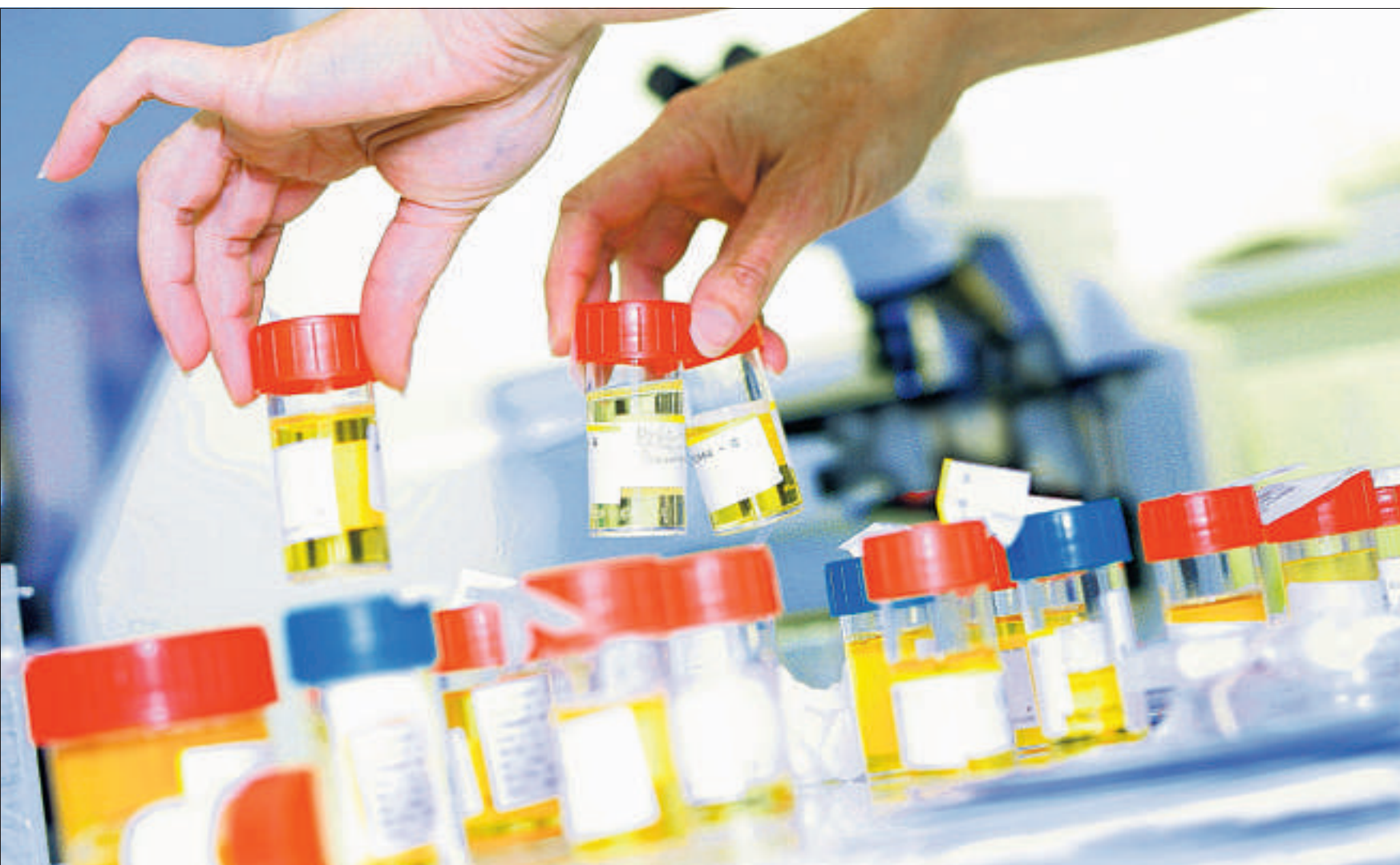
Heute dauert es oft Jahre, bis Tumorspuren im Blut nachgewiesen werden können. Ein Urintest könnte den Nachweis schneller erbringen.